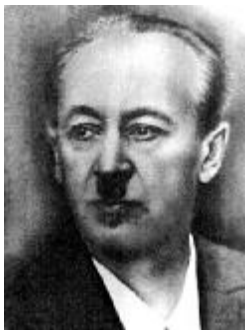
Академік АН СРСР Л. В. Писаржевський Один з директорів ДГІ (1923–1926 рр.)