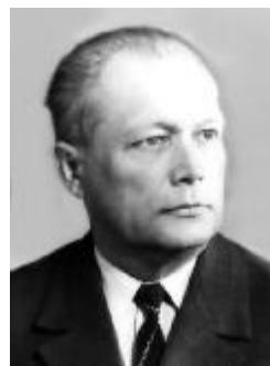
Професор Ю. М. Потебня Декан ЗВФ ДМетІ (1960–1965 рр.) Директор ЗФ ДМетІ (1966–1975 рр.) Ректор ЗІІ (1976–1983 рр.)