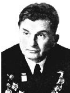
Член-кореспондент АН України, Професор Г. Г. Єфименко Ректор ДМетІ (1970–1973 рр.)