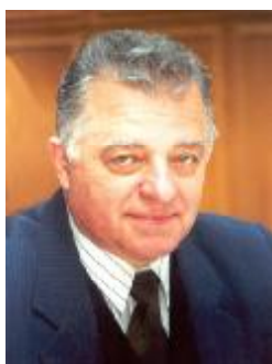
Професор М. П. Ревун Ректор ЗІІ – ЗДІА (1983–2003 рр.)