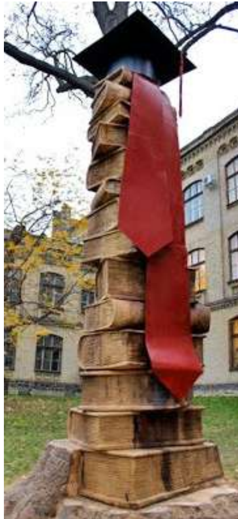
Сходи знань, НТУУ "КПІ"