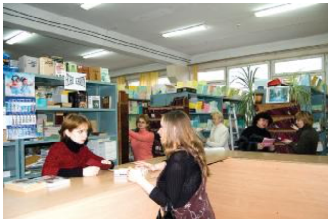
Абонемент навчальної літератури

Щорічно проводяться науково-технічні конференції студентів, магістрантів, аспірантів і викладачів ЗДІА. Кількість наукових доповідей за участю студентів зростає. Так, у 2004 р. на наукову конференцію ЗДІА було представлено 265 доповідей, з них 210 виконано самостійно студентами, а в 2007 р. – 740 доповідей, з них 629 самостійних. Студентами опубліковано 29 статей у фахових виданнях, з них 15 – самостійно, отримано 5 дипломів переможців на Всеукраїнському конкурсі студентських наукових робіт.