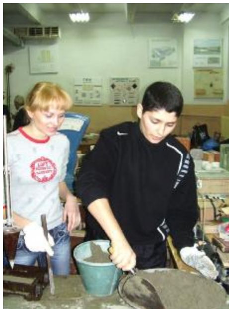
Майбутні будівельники в лабораторії

Підвищенню ефективності самостійної роботи студентів та рівня організованості їх поточної навчальної роботи, безумовно, сприяло впровадження індивідуальних навчальних планів. Такі плани за завданням керівництва академії, було розроблено