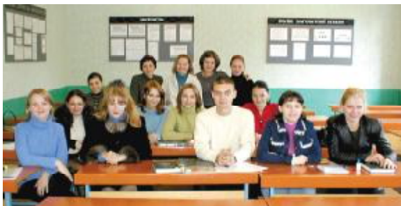
Засідання студентського Клубу бухгалтерів

Ректорат приділяє значну увагу фізичному вихованню студентів під час навчального процесу. Заняття з фізичного виховання студентів проводяться на перших двох курсах по чотири години на тиждень. На старших курсах фізична підготовка здійснюється факультативно в численних спортивних секціях.