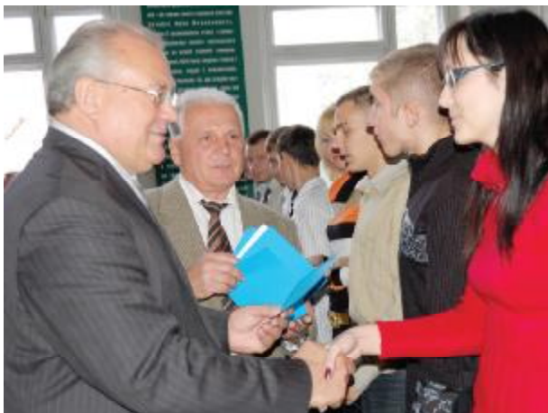
Мер міста Запоріжжя Є. Г. Карташов вручає сертифікати іменних стипендій кращим студентам

У концепції Державної програми розвитку освіти на 2006–2010 рр. зазначається, що “розвиток суспільства базується на єдності освіти і науки, що є основою розвитку системи освіти, дієвим фактором реформування суспільства”. У сучасних умовах вищі навчальні заклади займаються не тільки освітньою діяльністю, а й являють собою регіональні науково-дослідні центри. Запорізька державна інженерна академія розташована у великому промисловому регіоні, що зумовлює широкий спектр наукових досліджень.