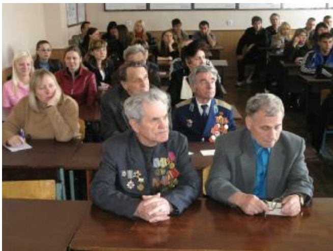
Ветерани в Політичному клубі академії