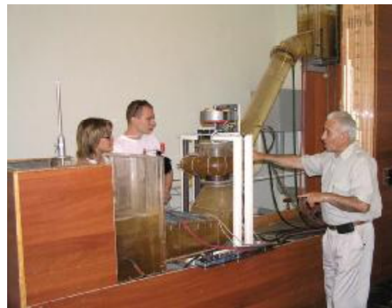
Лабораторні дослідження моделі гідроагрегата

Підвищення кваліфікації науково-педагогічних кадрів відбувається через підготовку