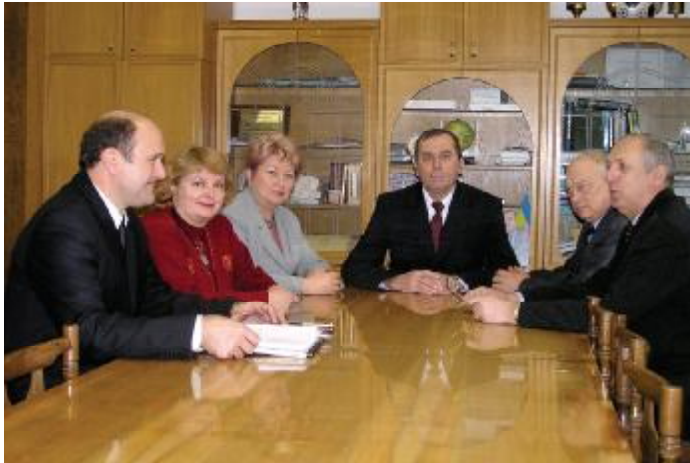
Засідання ректорату ЗДІА

До складу академії входить два коледжі – металургійний та гідроенергетичний. Ліцензія надає коледжам право на провадження освітньої діяльності з підготовки молодших спеціалістів за 16-ма спеціальностями з 10-ти напрямів. Обидва коледжі – навчальні заклади першого рівня акредитації. Всі спеціальності коледжів ліцензовано й акредитовано за першим рівнем; випусникам присвоюється кваліфікація молодшого спеціаліста.