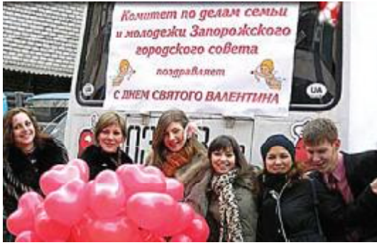
Святкування дня всіх закоханих

У виховному процесі важливе значення має робота клубів ЗДІА. Продовжують успішно функціонувати Філософський та Політичний клуби. Дедалі популярнішим стає Клуб бухгалтерів.