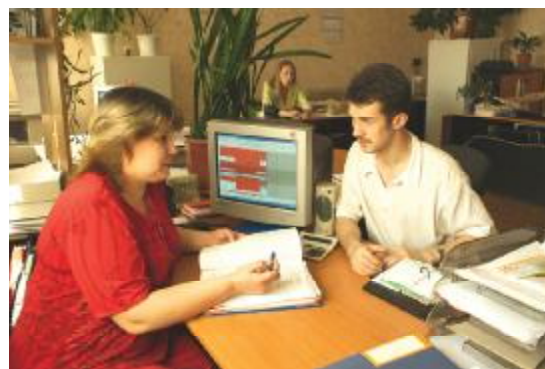
На факультеті післядипломної освіти

Вже на початок 2003–2004 н.р. було сформовано 8 факультетів за базовими напрямками і спеціальностями: металургійний, механіко-технологічний, інформаційних технологій, будівництва та водних ресурсів, електроніки та електронних технологій, енергетики та енергозбереження, економіки підприємства, менеджменту та фінансів. До організаційної структури навчальних підрозділів увійшли також факультети післядипломної освіти й довузівської підготовки.