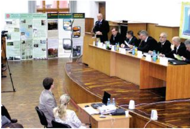
На науково-технічній конференції

докторських та кандидатських дисертацій, стажування, навчання в аспірантурі та в докторантурі, навчання на ФПО; практикуються перехід на посаду наукового співробітника та творчі відпустки.