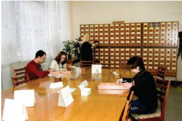
Зал каталогів бібліотеки

науково-дослідних робіт кафедри або проведення самостійних досліджень під керівництвом викладачів. Значна увага приділяється реальному курсовому та дипломному проектуванню на замовлення підприємств з подальшим впровадженням розробок у виробництво.