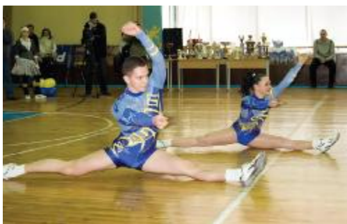
Виступ студентів на щорічному Балі аеробіки

виступала в першій лізі чемпіонату України, а в 2007 р. посіла третє місце у вищій лізі чемпіонату України. Жіноча волейбольна команда ЗДІА, яка виступає в вищому ешелоні волейболу України (суперліга), в сезонах 2003–2004 рр. та 2004–2005 рр. виборола срібні медалі чемпіонату України.