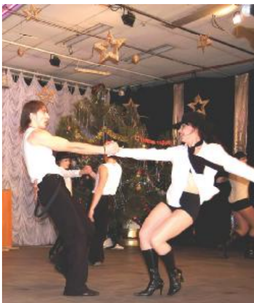
Виступають студенти – учасники студентського центру мистецтва "Port –Arte"