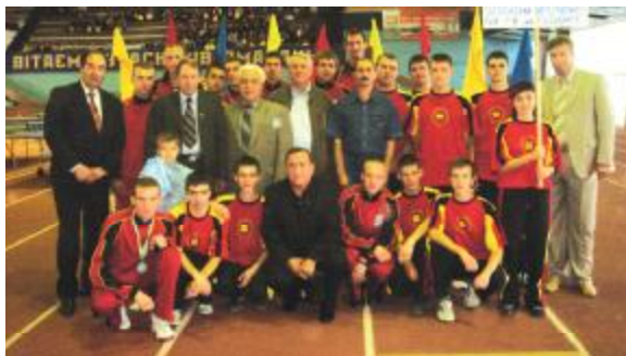
Чемпіони II студентської спартакиади серед ВНЗ I-II рівнів гірнично-металургійної промисловості