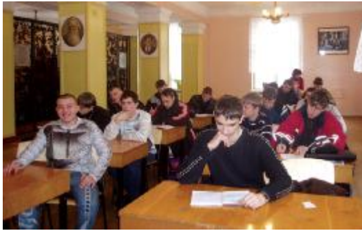
У читальній залі коледжу