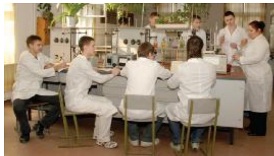
Лабораторія технічного аналізу