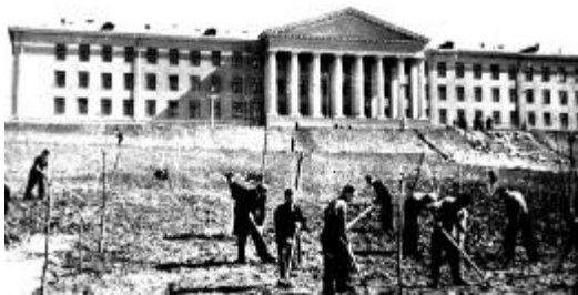
Благоустрій щойнозбудованого навчального корпусу технікуму, 1959 р.