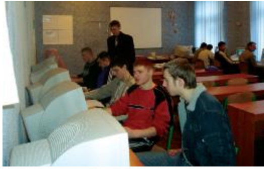
У лабораторії обчислювальної техніки

За досягнуті успіхи в навчально-виховній роботі металургійному технікуму в 1982 р. першому серед 29 технікумів системи Мінчормету України було присвоєно звання зразково-показового навчального закладу і створено кольоровий кінофільм “Перший зразковий”.