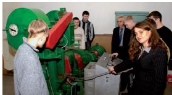
У лабораторії прокатного виробництва сталі