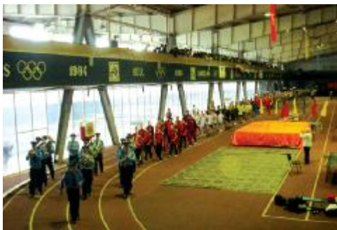
У спортивному манежі ВАТ “Запоріжсталь”