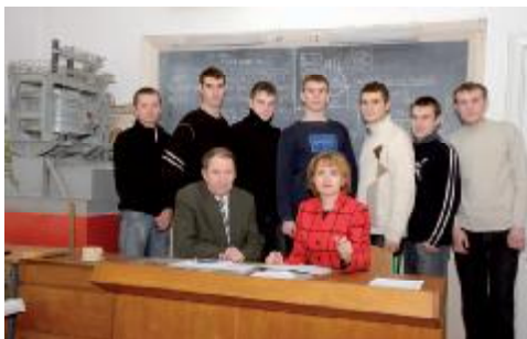
У лабораторії електрометалургії сталі і сплавів