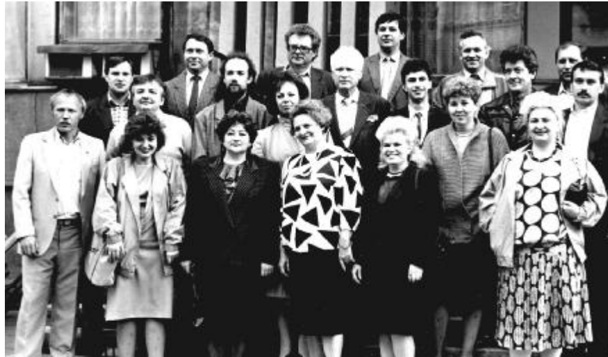
Один з перших випусків курсів підвищення кваліфікації керівників та спеціалістів промислових підприємств м. Запоріжжя.