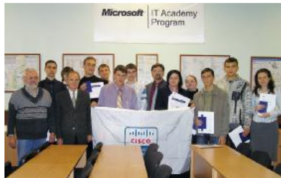
Випуск групи програмного забезпечення авто- матизованих систем, 2007 р.

консультаційних, інформаційних та маркетингових досліджень ринку; навчально методичне забезпечення системи післядипломної освіти фахівців галузі.