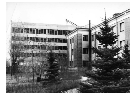
Строїться Лабораторний корпус