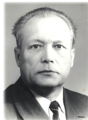
Юрій Михайлович ПОТЕБНЯ Оснoвaтeль акадeмії

Академічна мантия та шапочка. В урочисті дні, на вузівські свята деяким студентам надається можливість з'явитися в аудиторіях і залах в академічній мантиї та шапочці з китицею.